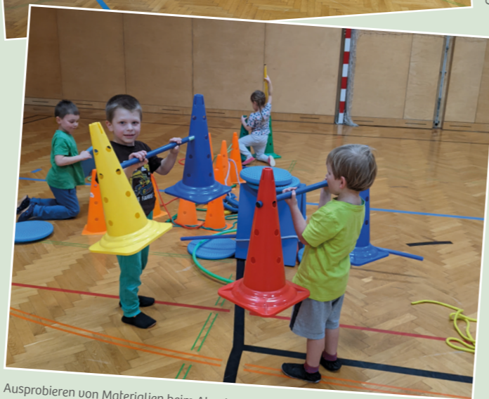
Ausprobieren von Materialien beim Abenteuerturnen