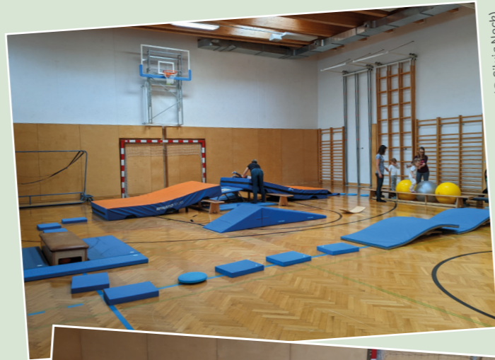
Gerätelandschaft beim Eltern-Kind-Turnen

Für den Sportverein Ampass Silvia Nock und Romana Berrer-Baumgartinger